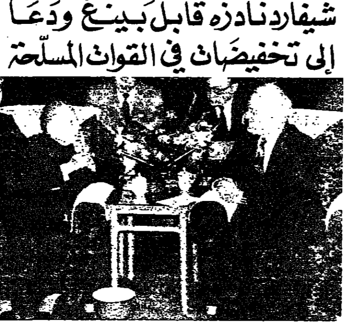
شيفارد نادزه خلال لقائه مع بينغ